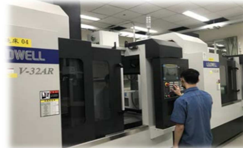
電腦數值控制機具實習